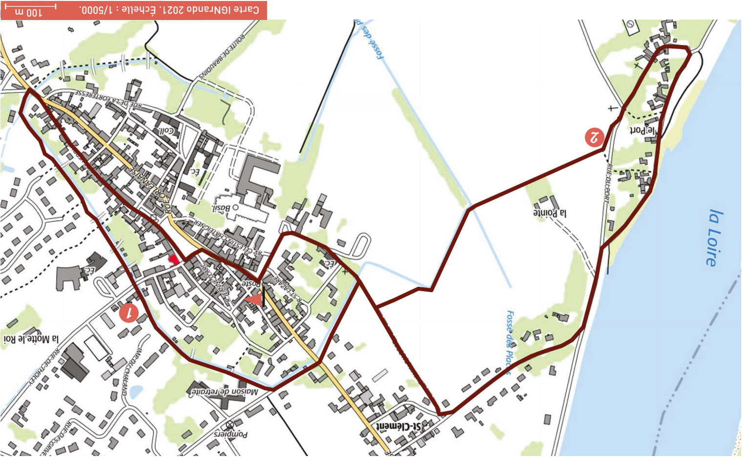
Carte IGNrando 2021. Echelle : 1/5000. 100 m