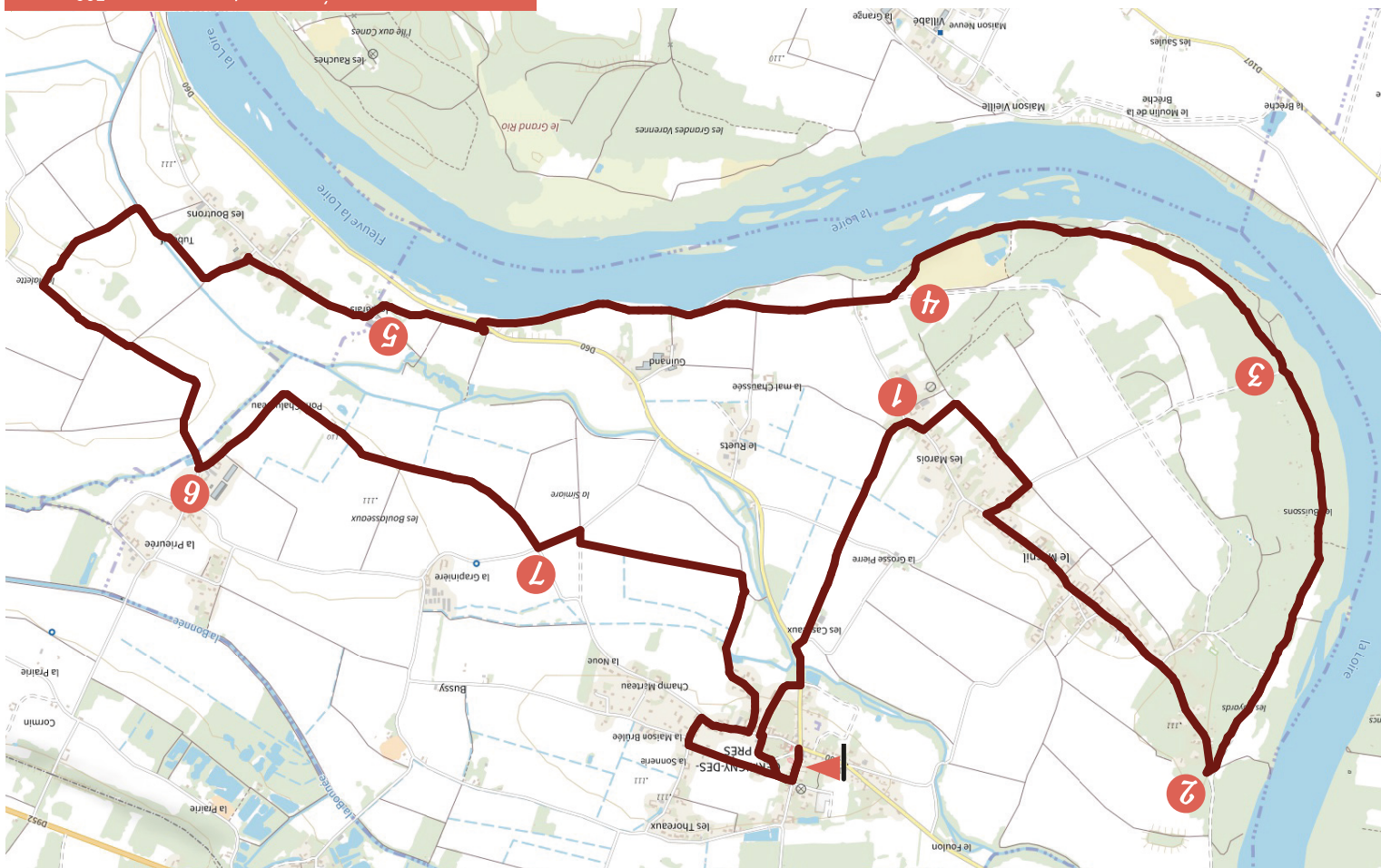
Carte IGNrando 2022. Echelle : 1/20000. 500 m