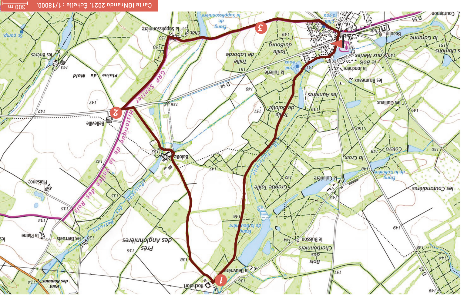
Carte IGNrando 2021. Échelle : 1/18000. 300 m

▶ Départ et parking : aire de loisirs, rue de Sully. Longez l'étang communal. Continuez tout droit, prenez la rue de Rochefort à droite. Allez tout droit à l'intersection sur le CR 3.